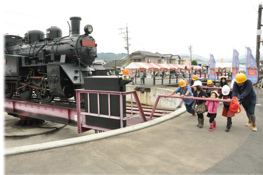
▲秋の恒例SLフェスタも大人気！