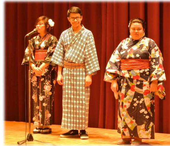
▲平成27年度のリッチモンド市からの 友好親善使節

リッチモンド市には市役所にシマダルームという会議室、市長室前には過去交流で交わしてきた品や島田市から贈られた品が展示され、シマダフレンドシップパークという公園があるなど長く深い交流の証を垣間見ることができます。