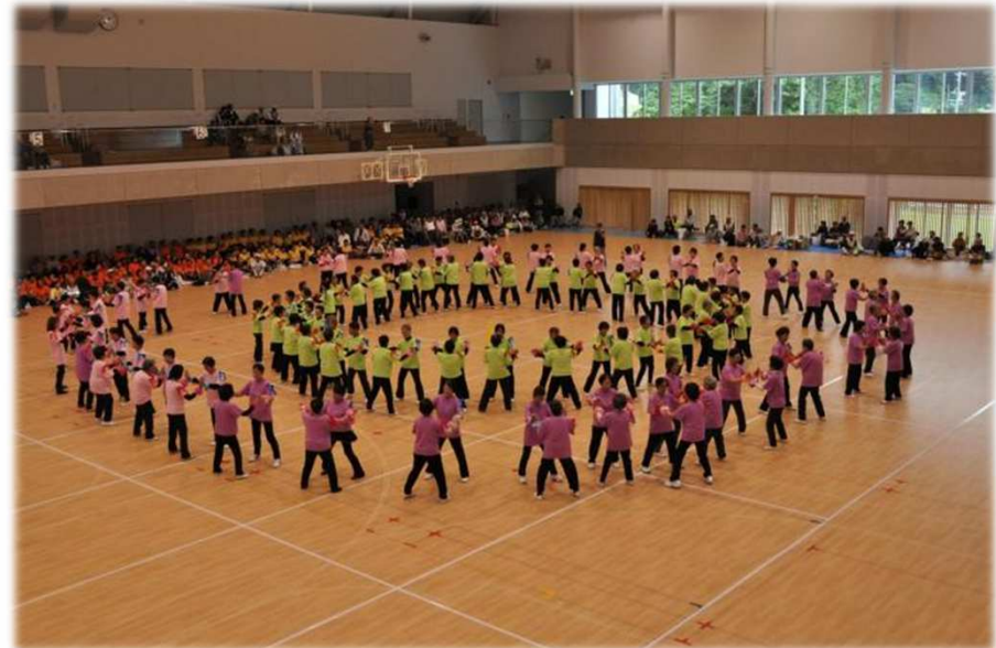
▲いきいきクラブ スポーツ大会の様子