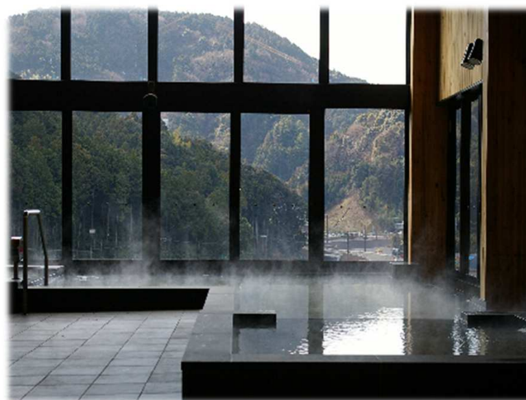
▲田代の郷温泉「伊太和里の湯」