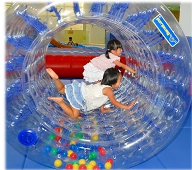
▲子育て支援にも力を入れています

島田市ではまち・ひと・しごと創生「人口ビジョン」にて2060年の目標人口を8万人と定め、「総合戦略」を策定し、人口減少社会に対応していきます。