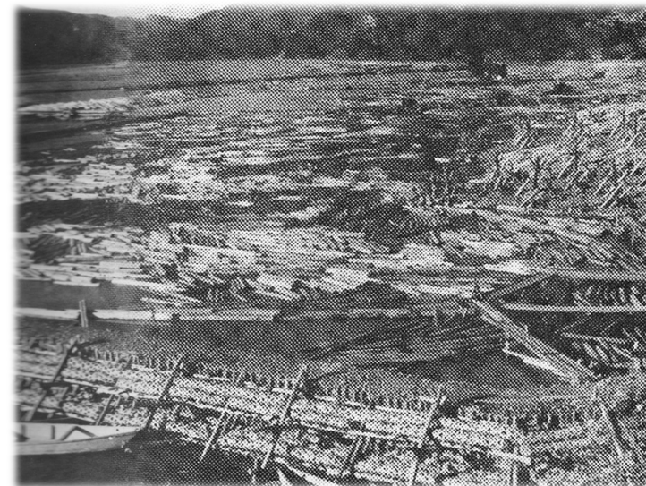
▲木都と呼ばれていた頃の島田(明治頃)

ちなみに現在でも使われている「三ツ合町」という地名 はその用水路が合わさることに由来しています。