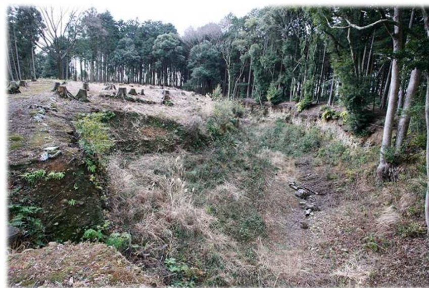
▲現在の諏訪原城跡