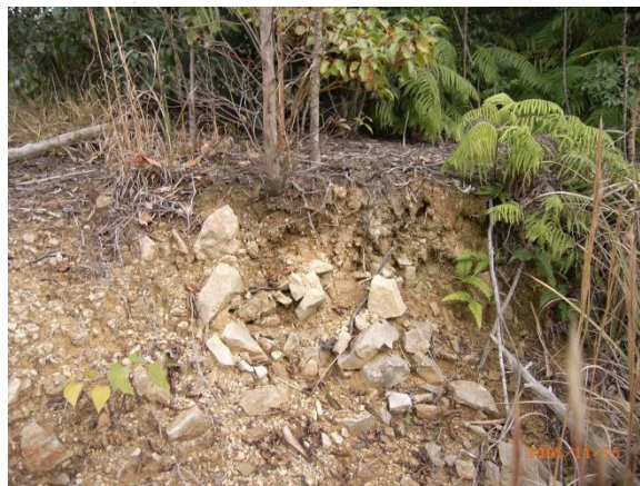
田代地区、尾根部の乾性褐色森林土壌 土壌層が薄く、貧栄養